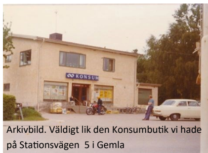
Arkivbild. Veldig lik den Konsumbutik vi hade på Stationsvägen 5 i Gemla

att få arbeta inom handeln. Den 15 februari 1946 anställdes jag som varubud inom Konsum Växjö. En skicklig och duktig butikschef förstod att jag var intresserad och ville lära mig yrket. Han gav mig förtroende, vägledning och stimulans. Ganska snart fick jag bli biträde och betjäna kunder vid disken. År 1949 blev ett jobb ledigt inom Konsum Gemla. Jag sökte och anställdes som biträde inom specier och div. varor som ingick i sortimentet i den tidens butiker.