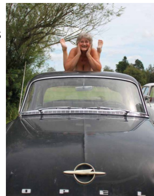
Bilen eller Bruden??

På 50 och 60 talet var Micki Leksaker en trogen kund hos Linnérs Motorfirma i Alvesta. Säljarna hade varsin Opel. Denna bild ingick i en av GM:s annonskampanjer och fanns i de flesta veckotidningar. En kund till Micki skickade över bilden gjord som ett pussel med 100 bitar. Text: Ola Aronsson