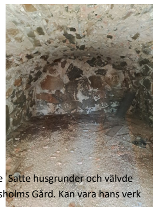
Satte husgrunder och välvde potatiskällare. Dess finns nära Gransholms gård. Kan vara hans verk