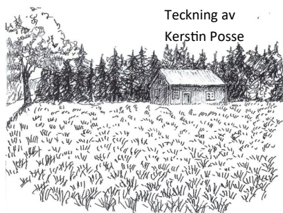
Teckning av Kerstin Posse

- Älgtjuren med skovelhorn. Han körde upp skogsvaktaren i ett träd. Han satt där i sex timmar. Han fick kramp från tårna till livremmen. August gick in och damen gick några steg men vände snart mot bilen. Sista biten sprang hon. Ibland kan det löna sig att ljuga.