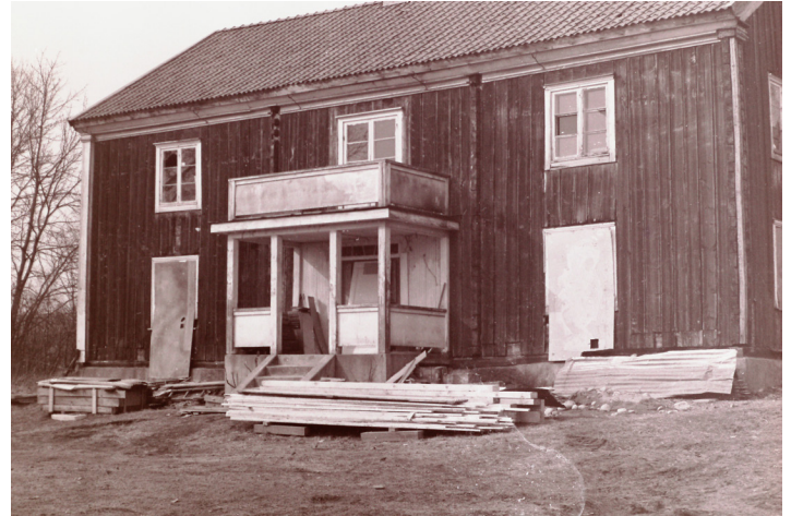
Gemla Säteri 1969-70

Det finns en del soldattorp. Falkstugan, Gemla Södergård Mulavad Öpestorp, Blads Usteryd med flera. Öja Hembygdsförening har en studiecirkel igång med uppgift att kartlägga soldattorpen i församlingen.