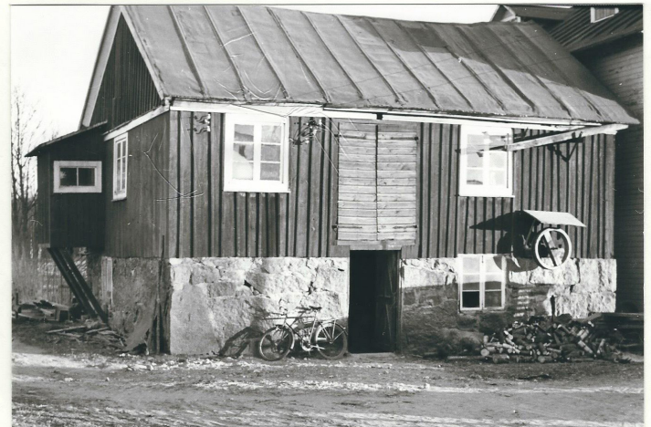
Gemla Kvarn 1930