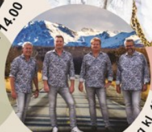
Engdahls Söndag kl. 17.00